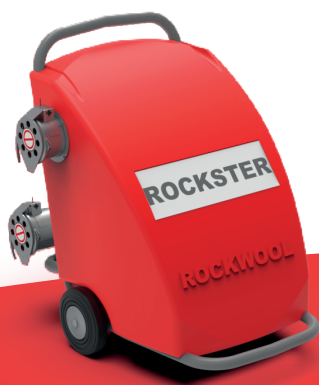
Rockster 2 (RD & RA)