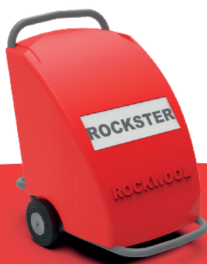
Rockster 2S (RDS & RAS)