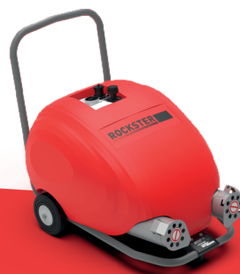
Rockster 3 (RT)